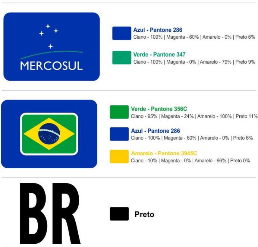
FIGURA IV – MARCAS D'AGUA DE SEGURANÇA DA PELÍCULA RETRORREFLETIVA